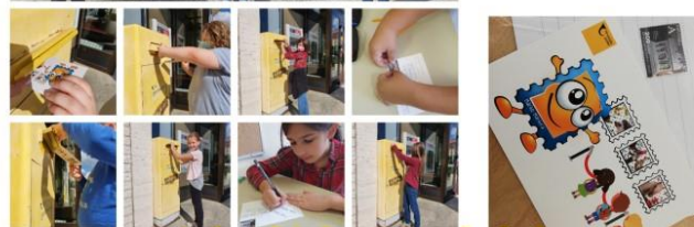
Svjetski dan razglednica